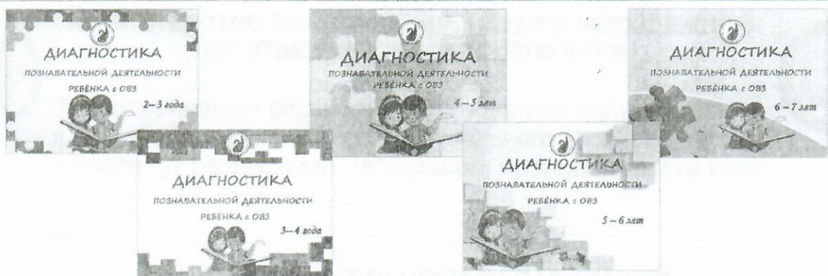
Рисунок 2. Диагностические кейсы

Все продукты прошли апробацию, имеют рецензии и представлены на сайте нашей организации.